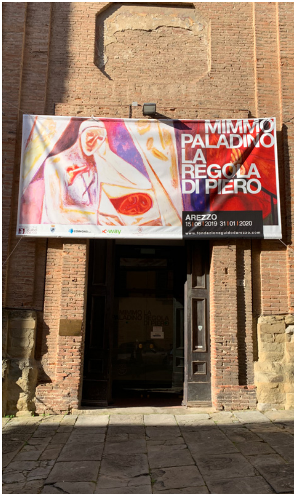
> Mostra “Mimmo Paladino, la Regola di Piero”, sede espositiva de I Dormienti, Chiesa sconsacrata di S. Ignazio, Arezzo.

a dire che il tipo di applicazione necessaria, fatto di attenzione, pazienza, osservazione dei fenomeni fisici e dei cambiamenti chimici, può spingere i più attenti a riflessioni che travalichino il mero aspetto tecnico, ma coinvolgano altri campi del sapere scientifico, come la matematica e la scienza del calcolo; può portare l'artista interessato, ad esempio, ad andare oltre il Piero della Francesca finissimo artista, e leggere la sua De Prospectiva Pingendi per essere catturato dal Piero matematico; può non solo apprezzare nell'arte del secolo appena trascorso la sfrenata fantasia pop di Warhol, la combinatoria di Rauschenberg e la spontanea creatività di Pollock, ma anche comprendere appieno il serio rigore di Vantongerloo e Mondrian. Tra i torchi, insomma, può sorgere la transdisciplinarietà.