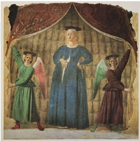
> Piero della Francesca, La Madonna del Parto , (ca. 1455). Museo della Madonna del Parto, Monterchi.