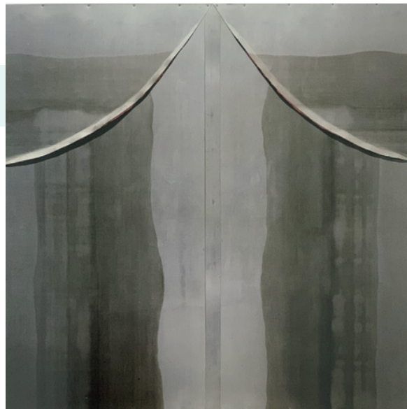
> Alberto Burri, Il Viaggio n. 1 (1979), in Collezione Burri a cura di Bruno Corà, Fondazione Palazzo Albizzini Collezione Burri (2015), pag. 67.

vilimento. Un altro punto è che le tecniche, manuali o formali, si devono padroneggiare al massimo per poter dimenticare che esistono. Ma per potersene veramente appropriare si deve diventare loro cultori a livelli assolutamente straordinari. Poi c'è l'atto creativo che – anche se sappiamo subito riconoscerlo quando c'è – non sappiamo ancora bene cosa sia e da cosa tragga origine.