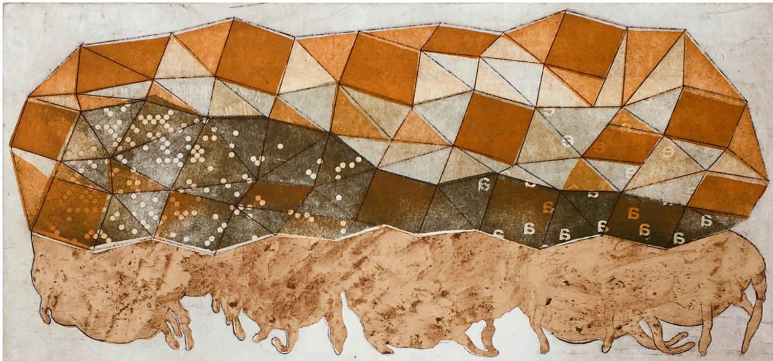
> Marco Elio Tabacchi , Castell'inaria Step IV (part.) , (2018). Acquaforse Acquatinta tricromica con fondino trasgressivo.

ti sono presenti nei paragrafi 4 e 5). Impegni iniziati per approfondire interessi e curiosità intellettuali sono diventati inevitabilmente un'estensione ragionata sia delle attività scientifiche (moderatamente) disciplinari usualmente svolte sia delle riflessioni su come le diverse discipline possano o debbano interagire.